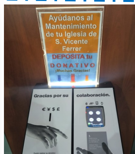
Ahora Donar Es Más Fácil. Gracias por tu aporte