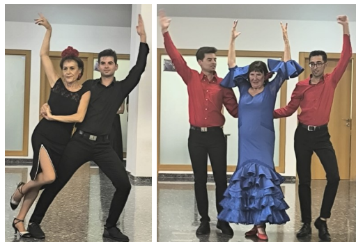
Encuentro Intercultural/30 mayo